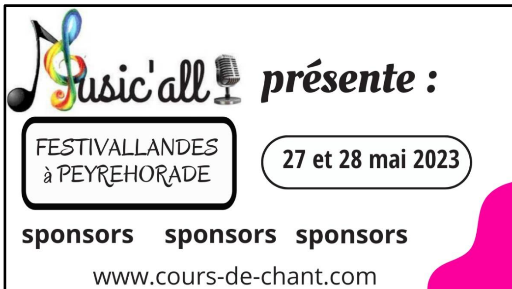
EXEMPLE DE BANDEROLLES