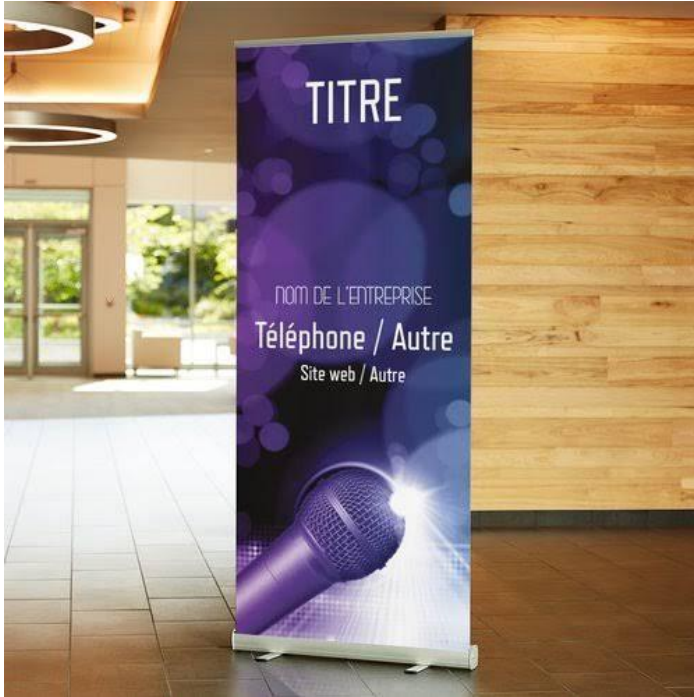
EXEMPLE DE ROLL UP

Vous allez être mis en avant sur les affiches, ROLL UP et banderoles ainsi lors des passages radios et TV.